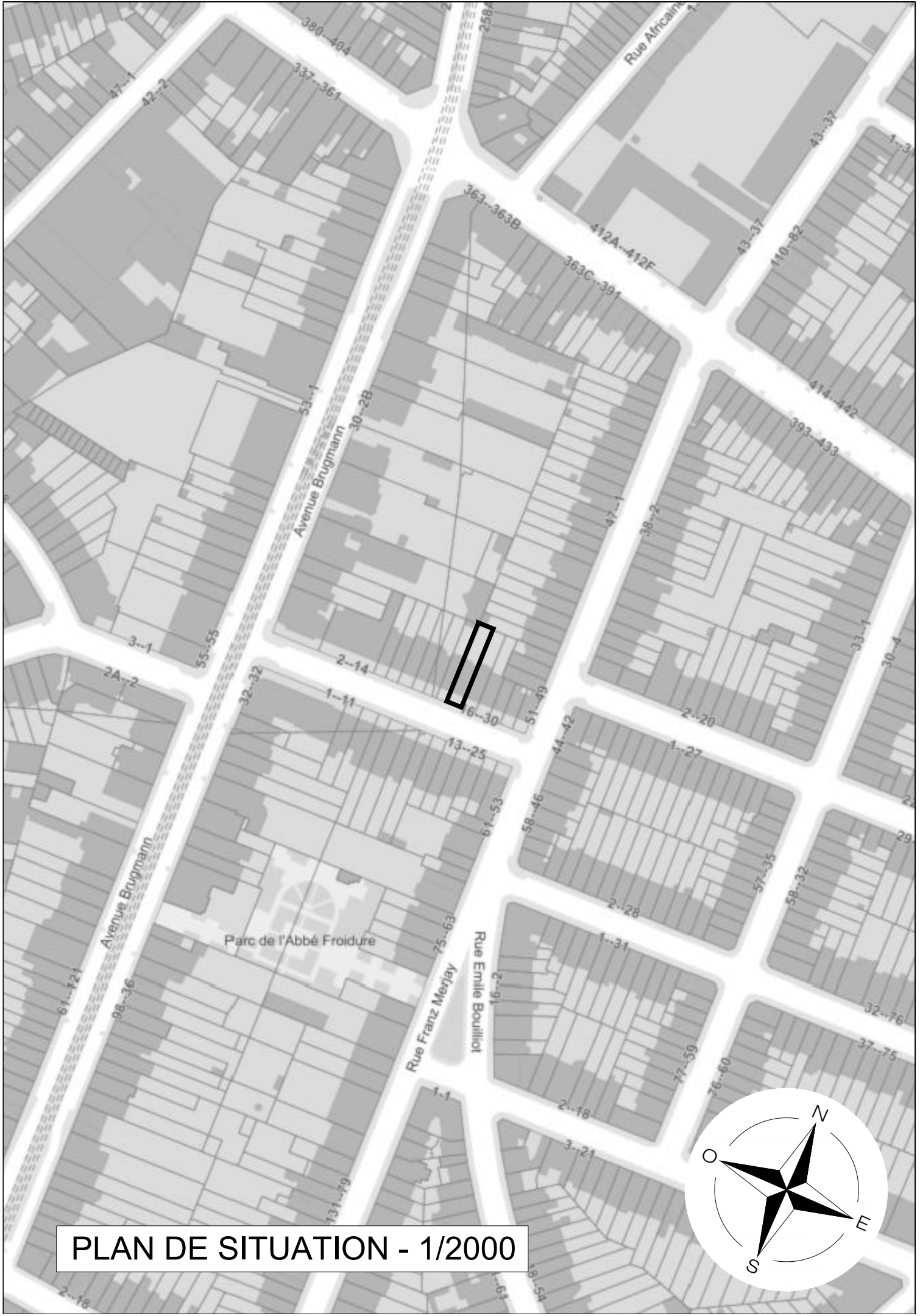
PLAN DE SITUATION - 1/2000